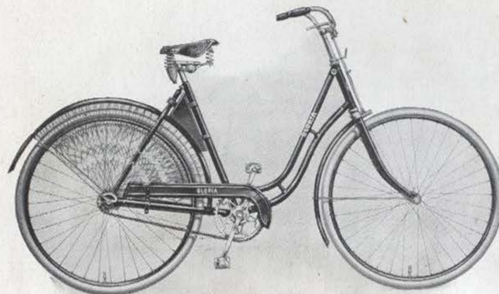
Gloria-Damenrad elegant und zuverlässig, für den guten Geschmack

Rahmen Innenlötung, bestes Tauchbadverfahren, aus 1a nahtlos gezogenen Stahlrohren. Höhe bei Herren 55 oder 60 cm, bei Damen 55 cm. Emaillierung tiefschwarz, hochglänzend, mit doppelten Linien abgesetzt. Gabelkopf abgerundet, vernickelt. Lenkstange englische Form mit kurzem Vorbau und Hebelbremse. Tretlager Doppelglockenlager. Kettenrad 48 Zähne 1/2 " Teilung, Innengewinde, auf Kurbel aufgeschraubt. Kurbeln Vierkantbefestigung. Laufträder Stahlfelgen für Wulstreifen 28 \times 1\frac{1}{2} ", schwarz emailliert mit grünem Mittelstreifen und Goldlinien, auf Wunsch holzfarbig emailliert mit schwarzen Strichen. Kette 1/2 \times 1/8 ". Pedale mit Gummieinlage. Sattel mit vernickelten Druck- und Zugfedern, gelbes Leder. Werkzeugtasche gelbes Leder, mit Werkzeugschlüssel und Oelkännchen.