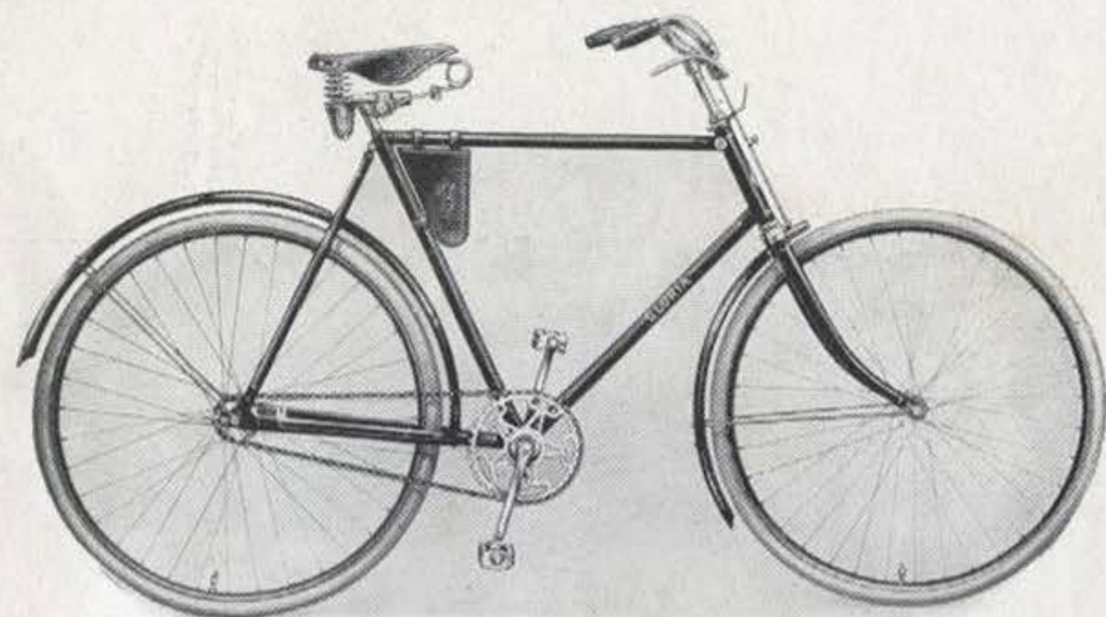
Gloria-Herren-Tourenrad die preiswerte und schnittige Gebrauchsmaschine

Rahmen Innenlötung, bestes Tauchbadverfahren, aus 1a nahtlos gezogenen Stahlrohren. Höhe bei Herren 55 oder 60 cm, bei Damen 55 cm. Emaillierung tiefschwarz, hochglänzend, mit doppelten Linien abgesetzt. Gabelkopf abgerundet, vernickelt. Lenkstange englische Form mit kurzem Vorbau und Hebelbremse. Tretlager Doppelglockenlager. Kettenrad 48 Zähne 1/2 " Teilung, Innengewinde, auf Kurbel aufgeschraubt. Kurbeln Vierkantbefestigung. Laufträder Stahlfelgen für Wulstreifen 28 \times 1\frac{1}{2} ", schwarz emailliert mit grünem Mittelstreifen und Goldlinien, auf Wunsch holzfarbig emailliert mit schwarzen Strichen. Kette 1/2 \times 1/8 ". Pedale mit Gummieinlage. Sattel mit vernickelten Druck- und Zugfedern, gelbes Leder. Werkzeugtasche gelbes Leder, mit Werkzeugschlüssel und Oelkännchen.